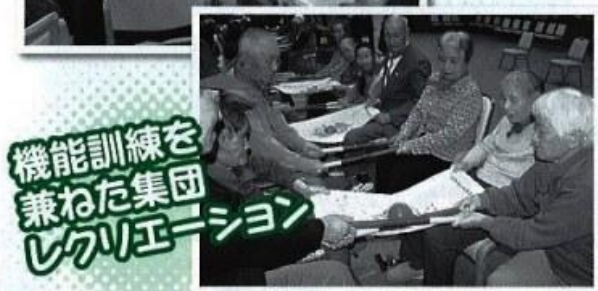
機能訓練を 兼ねた集団 レクリエーション