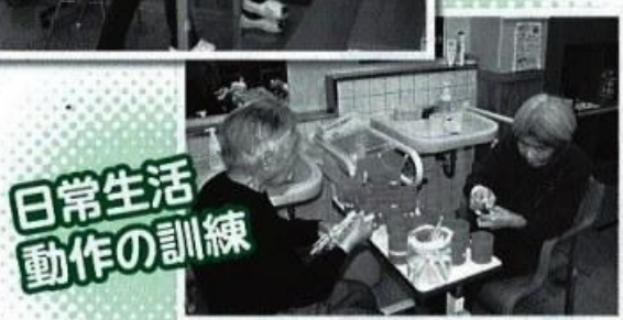
日常生活 動作の訓練