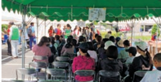
※順番を待つボランティア

今年発災した熊本地震においても災害ボランティアセンターが立ち上がり、たくさんのボランティアが復興のため現地に向かいました。越前町社会福祉協議会からも、熊本市災害ボランティアセンターの運営支援に職員が派遣されました。