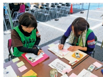
※現地で活動する社協職員

今年発災した熊本地震においても災害ボランティアセンターが立ち上がり、たくさんのボランティアが復興のため現地に向かいました。越前町社会福祉協議会からも、熊本市災害ボランティアセンターの運営支援に職員が派遣されました。