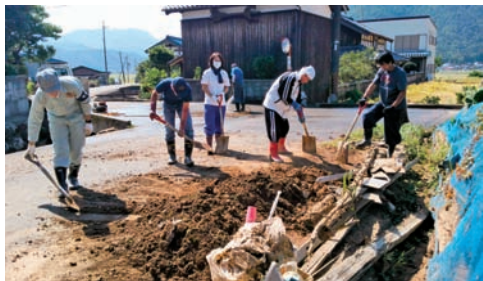
※道路や用水路の泥、ゴミ等の掃除をするボランティア

主な活動内容は、室内や敷地内の泥出し、小さい家具の移動、ゴミ出し、掃除などですが、被災地の要望や状況によって内容は変わります。