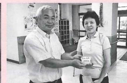
糸生小学校児童が育てた野菜の売上金の一部から