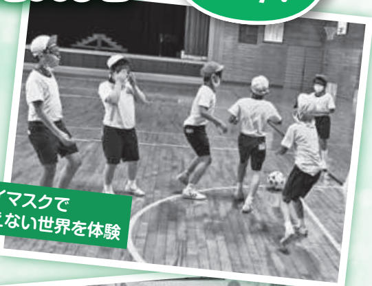
アイマスクで 見えない世界を体験