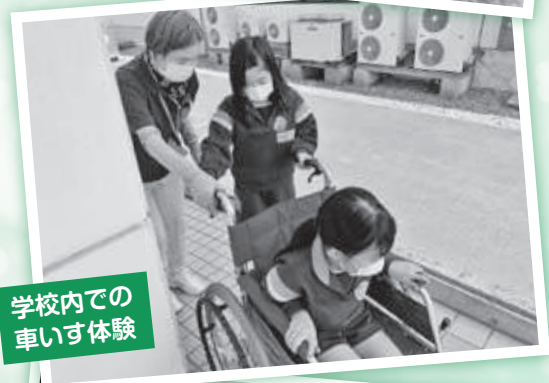
学校内での 車いす体験