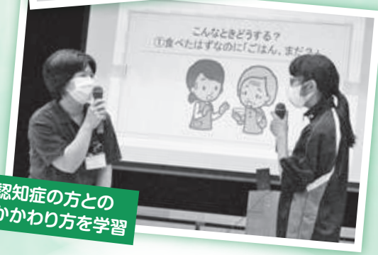
認知症の方との かわり方を学習