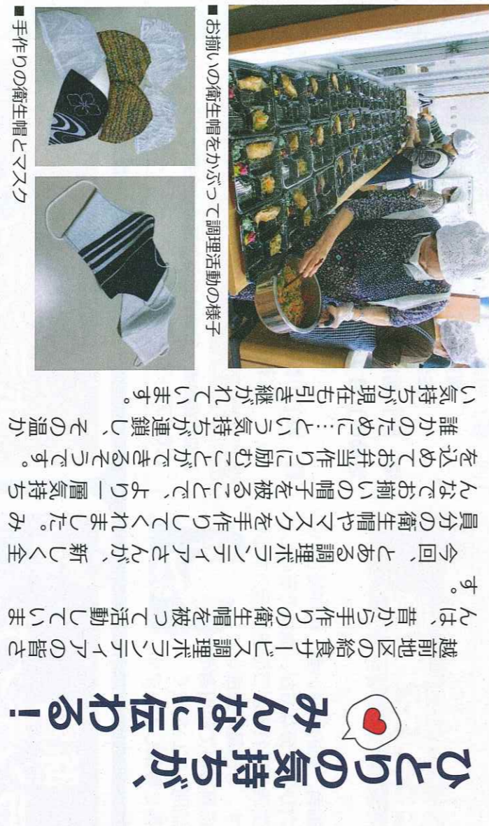
■手作りの衛生帽とマスク

【ひとりの気持ちが、 みんなに伝わる！】 越前地区の給食サービス調理ボランティアの皆さ んは、昔から手作りの衛生帽を被つて活動していま す。 今回、とある調理ボランティアさんが、新しく全 員分の衛生帽やマスクを手作りしてくれました。み んなでお揃いの帽子を被ることで、より一層気持ち を込めてお弁当作りに励むことができるそうです。 誰かのために...という気持ちが連鎖し、その温か い気持ちが現在も引き継がれています。