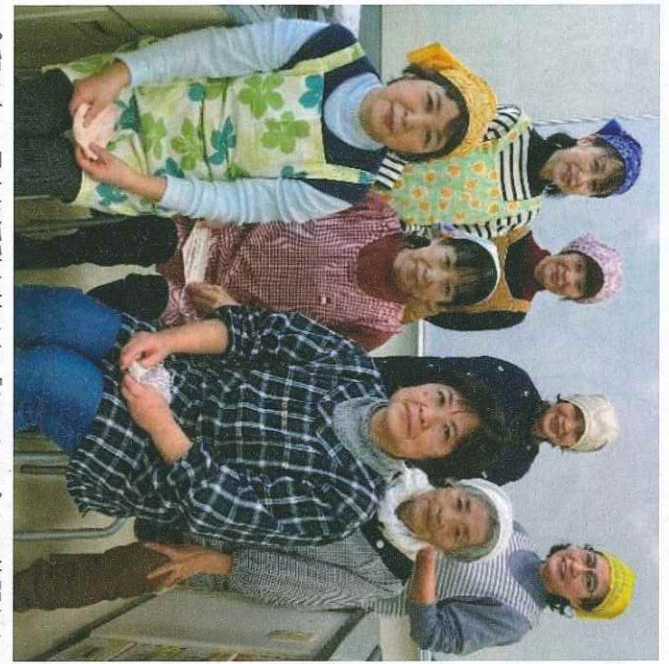
令和3年4月より活動を始めた「なでしこ会」の仲間たち

越前町社協では、調理が困難な高齢者等に、健康 維持や安否確認を目的に手作りのお弁当を届ける給 食サービスを実施しています。また給食サービスで は、お弁当を作る調理ボランティアが町内各地区で 活動を行っています。今回はその中の2つの活動を ご紹介します。