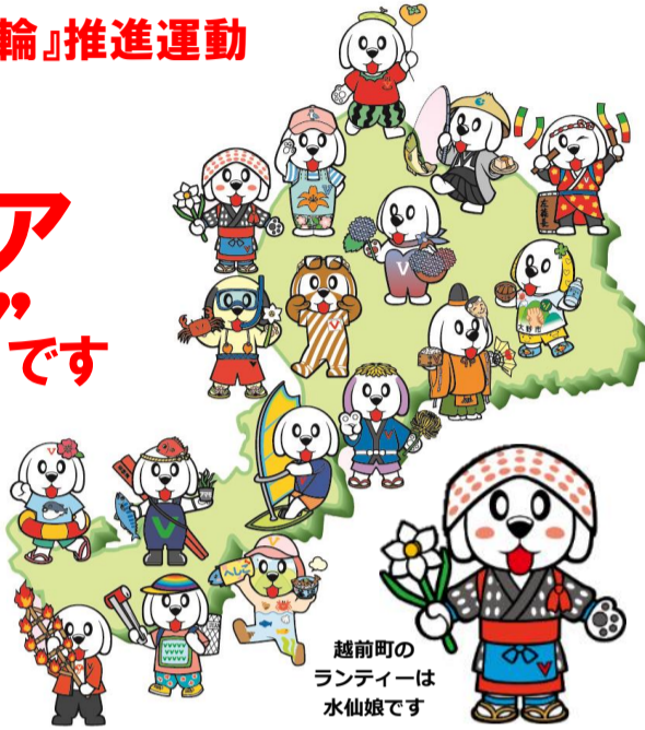
越前町のボランティアは水仙娘です