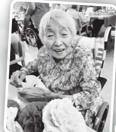
～つなぐ未来～ 越前町朝日デイサービスセンター「朝寿苑」