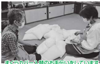
まくらカバー入替のお手伝いをしています

何かお手伝いできたらという気持ちでボランティアをしています。お互い助け合う気持ちを皆さんとも分かち合いたいと思います。